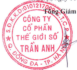
TRẦN XUÂN KIÊN